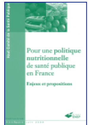
Pour une politique nutritionnelle de santé publique en France ISBN : 2-85952-629-3, 275 p., 170 F, 25,92 euros.

A u cours des dernières décennies, les grandes maladies liées aux carences alimentaires ont disparu. Pourtant, le lien entre alimentation et santé est plus que jamais d'actualité. En effet, les recherches récentes confirment que l'alimentation joue un rôle déterminant de protection ou d'aggravation du risque dans la survenue de maladies telles que les cancers, les maladies cardiovasculaires, l'obésité ou l'ostéoporose. Il apparaît aujourd'hui nécessaire de mettre en place un Programme national nutrition santé pour réduire le risque de maladies chroniques, améliorer l'état de santé et la qualité de vie de la population générale. Le Haut Comité de la santé publique propose également dans ce rapport des actions spécifiques pour résoudre certains problèmes nutritionnels observés dans les groupes à risque : femmes enceintes et allaitantes, enfants et adolescents, sujets âgés, personnes en situation de précarité... La nutrition est le thème prioritaire de santé publique choisi par la Présidence française de l'Union européenne en 2000.