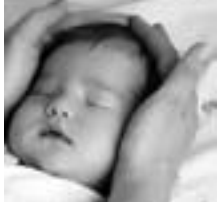
Plate-forme Périnatalité 2007 : propositions

1 La diversification de l'offre de soins par la création de filiales physiologiques comme elles existent chez nos voisins :